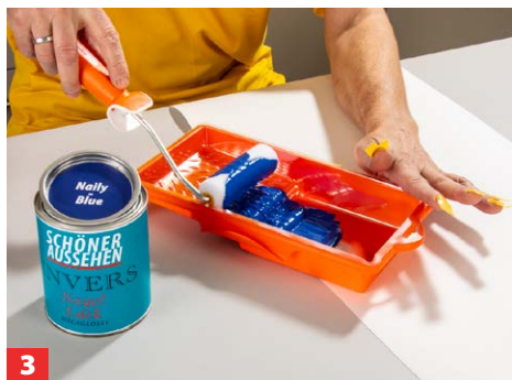
3 Nach dem Aufrühren den Invers-Nagellack in die Bade- oder Farbwanne geben.