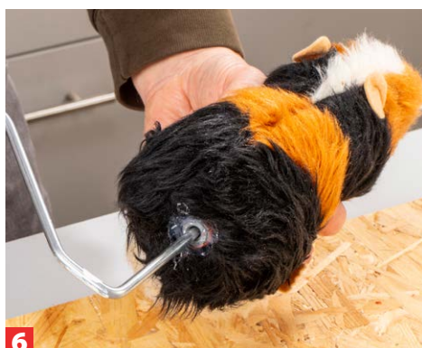
6 Das Tier können Sie nun auf den Farbbügel stecken. Fertig ist die Nager-Farbrolle!