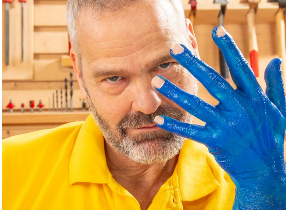
Text: Garry Glitter