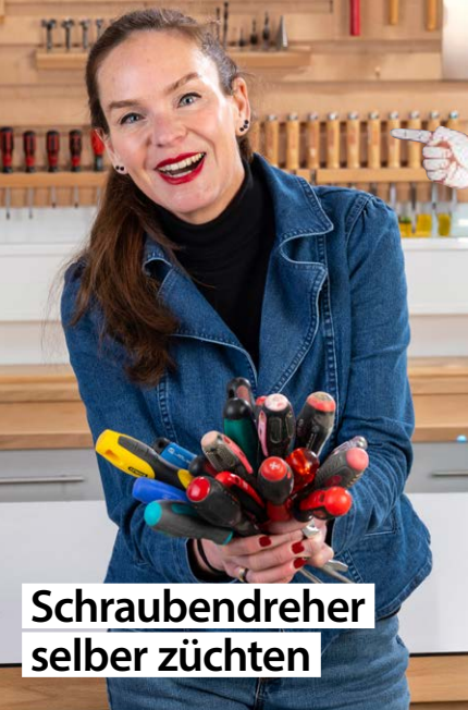
Schraubendreher selber züchten