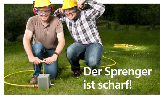
Der Sprenger ist scharf!

„Nach all den Tests ist jetzt das größte Projekt dran: Entspannung! Wir sind sicher, du meisterst den Ruhestand genauso gut!“