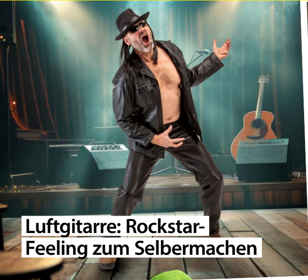
Luftgitarre: Rockstar- Feeling zum Selbermachen