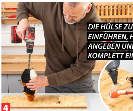
4 Anschließend durch die hintere Öffnung des Haustiers ein 13er Loch bohren.

DIE HÜLSE ZU 3/4 LÄNGE EINFÜHREN, HEISSKLEBER ANGEBEN UND DANN KOMPLETT EINSCHIEBEN.