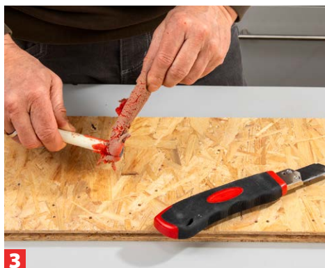
3 Trennen Sie zunächst aus einer eingetrockneten Farbrolle die Kunststoffhülse heraus.