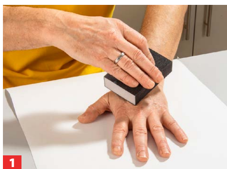
1 Zunächst schleifen Sie Ihre Haut grob an; bei Unreinheiten ggf. auch einen Elektrohobel oder Bandschleifer verwenden.