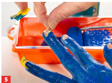
5 Noch im nassen Zustand das Klebeband vorsichtig abziehen.

ACHTUNG: PINSEL AUF VERTRÄGLICHKEIT PRÜFEN!