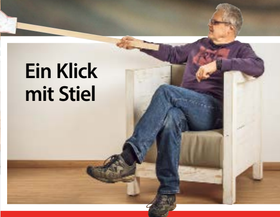
Ein Klick mit Stiel