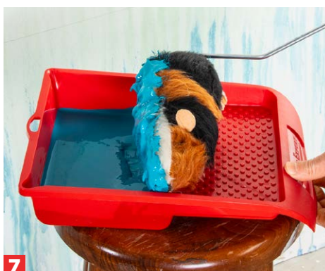
7 Geben Sie die Wandfarbe in eine Farbwanne und nehmen Sie die Farbe mit dem Roller auf.