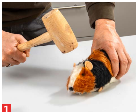
1 Wenn das geliebte Haustier stirbt, ist die Trauer groß. Doch das Ende kann auch ...

Nun ist es wichtig, seine Emotionen schnell in eine positive Richtung zu lenken und sich nicht der Trauer zu ergeben. Da war doch noch das Kinderzimmer, das seit Jahren auf einen Anstrich wartet. Das Projekt können Sie jetzt angehen. Ob Meerschweinchen, Hamster oder Zwergkaninchen, all diese Nager besitzen ein weiches, sehr nützliches Fell. Und es eignet sich hervorragend zum gleichmäßigen Auftrag von Farbe. Ihre Kinder können gerne bei den Vorbereitungen helfen, dann ist schnell aus dem lieb gewonnenen Haustier ein nützliches Arbeitsgerät geschaffen, denn Lammfellrolle war gestern! Tipp: Auch tote Igel lassen sich gut verwenden: als Stachelwalze zum Ablösen von Tapeten oder zum Belüften des Rasens.