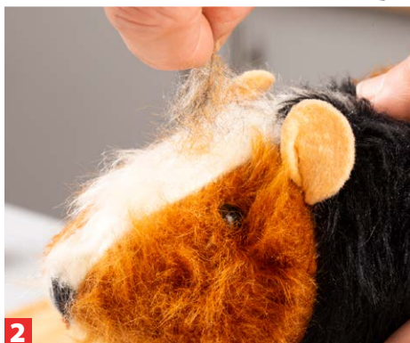
2 ... nutzbringend sein. Tiere, die im Fellwechsel verenden, gründlich durchbürsten!