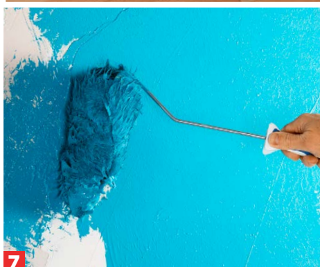
7 Die Farbe abstreifen, die Wand im Kreuzverfahren streichen und senkrecht verschlichten.

Text: Anni Maier