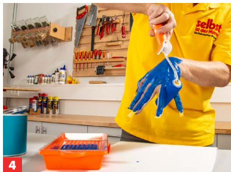
4 Die vorbereiteten Körperstellen anschließend mit einer Schaumwalze gründlich ablackieren.